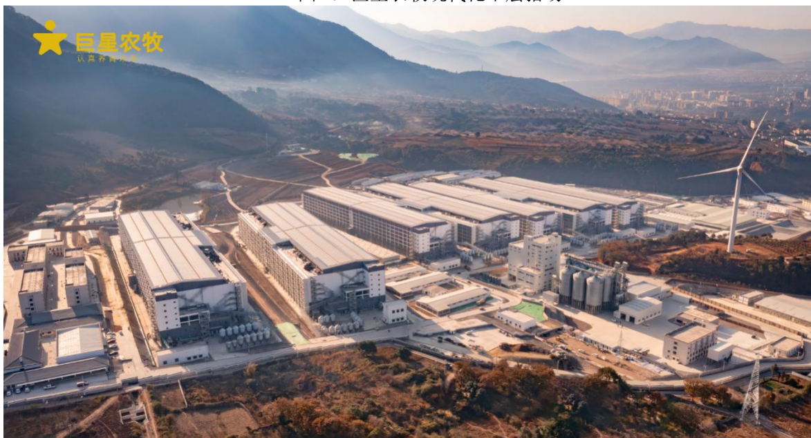
图 2：巨星农牧现代化楼房猪场

此外，现代化生猪养殖行业已从传统的育肥逐渐延伸至集基因筛选、种猪选育、动物疫病防治、科学饲料配比等跨越多体系、多学科的系统性工程，市场参与者需综合考量育种效率、料肉转化率、日增重、病死率、饲料成本等多因素，不断提升养殖技术、优化养殖管理，并及时捕捉市场信息，对市场周期波动做出正确判断。生猪养殖行业已不再是简单的劳动密集型产业，养殖门槛的提升进一步加快我国生猪养殖行业现代化进程，助推我国生猪养殖行业向技术密集型、知识密集型产业的转型升级。