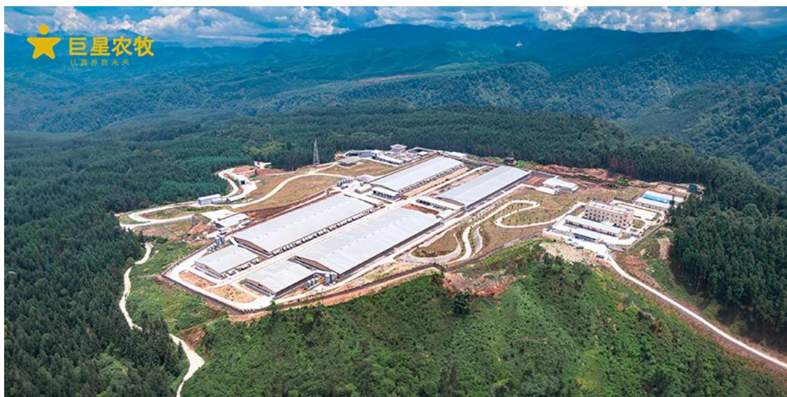
图 1：巨星农牧现代化平层猪场