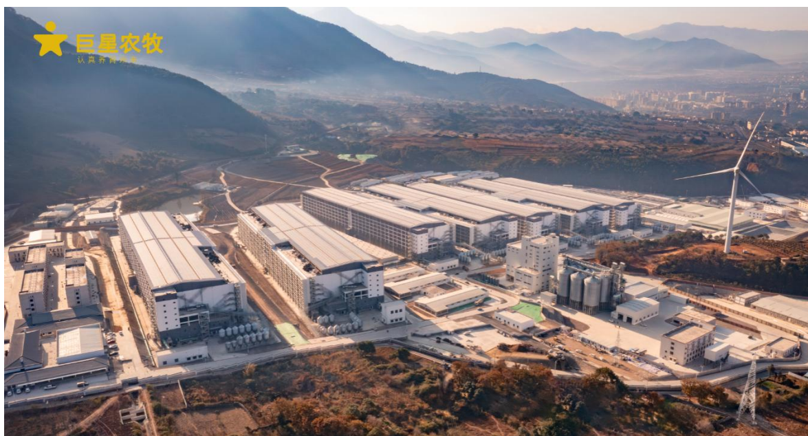
图 2：巨星农牧现代化楼房猪场

此外，现代化生猪养殖行业已从传统的育肥逐渐延伸至集基因筛选、种猪选育、动物疫病防治、科学饲料配比等跨越多体系、多学科的系统性工程，市场参与者需综合考量育种效率、料肉转化率、日增重、病死率、饲料成本等多因素，不断提升养殖技术、优化养殖管理，并及时捕捉市场信息，对市场周期波动做出正确判断。生猪养殖行业已不再是简单的劳动密集型产业，养殖门槛的提升进一步加快我国生猪养殖行业现代化进程，助推我国生猪养殖行业向技术密集型、知识密集型产业的转型升级。